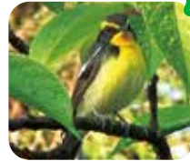
キビタキ オスだけがカラフル！