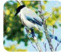
オナガ 実はカラスの仲間！