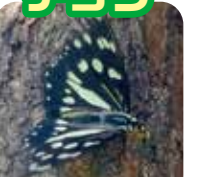
ゴマダラチョウ 木の樹液が大好物！