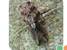
ニイニイゼミ “ニーイー”と鳴くよ