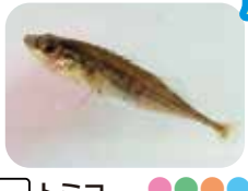
トミヨ 冷たい淡水に住む魚で、オスが子育てするよ