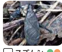
スズムシ “リーンリーン”と夕方以降によく鳴くよ