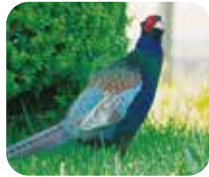
キジ 森の中をよく歩いているよ