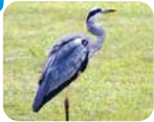
アオサギ 足が長い大きな鳥