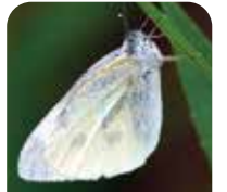
モンシロチョウ 羽のふちに黒い模様