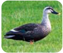
カルガモ くちばしの先だけが黄色