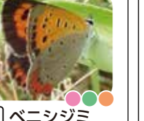
ベニシジミ 季節が移るにつれベニ色が深くなるよ