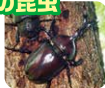
カブトムシ 夜になると樹液に集まるよ