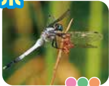
シオカラトンボ メスは茶色でムギワラトンボとも