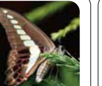
アオスジアゲハ 高い所をよく飛んでいるよ