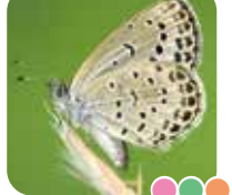
ヤマトシジミ 羽を開くと青色！