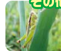
イナゴ 昔はよく食用とされていたよ