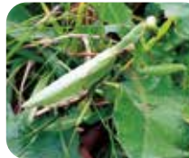
カマキリ 他の虫を食べる肉食系！