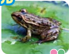
トノサマガエル “ブルルル”と鳴くよ