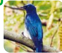
オオルリ “ピールピー”と鳴くよ