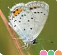
ツバメシジミ 後羽のオレンジが目印