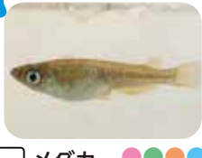
メダカ 寒い地域にいるメダカがいるよ